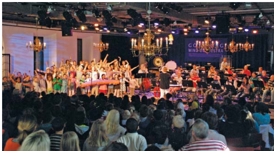
"Konserten för alla åldrar" med musik från Astrid Lindgrens filmer lockade många

Ett stort antal barn och vuxna avnjöt lördagen den 10 maj "Konserten för alla åldrar" nämligen musiken från Astrid Lindgrens filmer. Härligt att se barnens engagemang, de både sjöng och dansade med. GWO visar att de inte har några begränsningar vad gäller genrer.