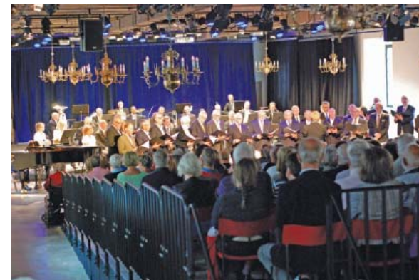
Kören på plats i Kronhuset

Höstens konserterande inleddes med en konsert under kulturkalaset den 14 augusti tillsammans med Lill Lindfors. Som vanligt, trots den sena tidpunkten och hot om regn var Götaplatsen i Göteborg fylld med en entusiastisk publik. Succé som vanligt.