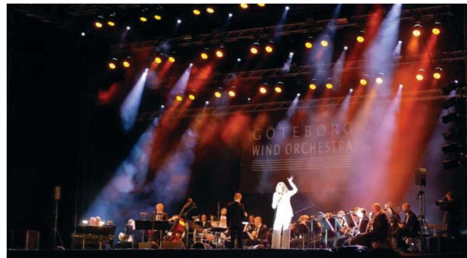
GWO och Lill Lindfors på Götaplatsens scen